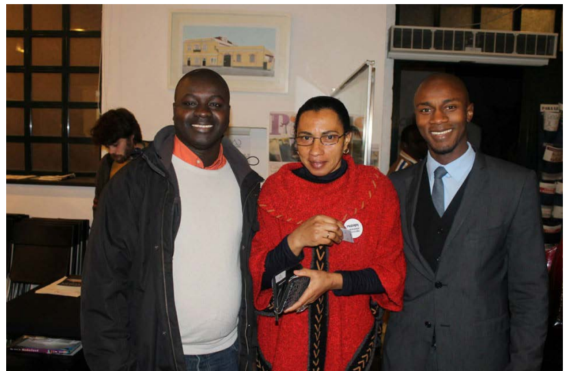
Ricercatori della comunità portoghese nel Giorno della Donna in Guinea Bissau.