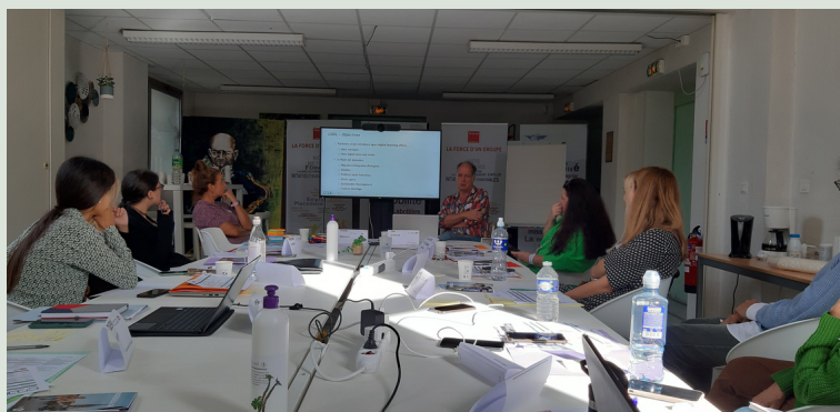
Identification of challenges to be tackled

Divisi in 3 squadre, i formatori hanno lavorato su 3 progetti e hanno progettato prototipi e strumenti che saranno esposti in una mostra che mescola oggetti reali e virtuali.